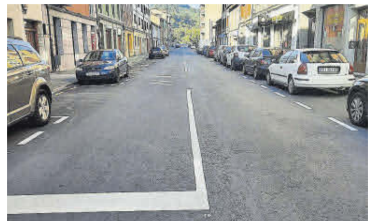
Arriba, pabellón de Langreo en la FIDMA. Abajo, asfaltado de una calle en Lada.

La Agrupación Socialista de Langreo desea a las vecinas y vecinos ¡FELICES FIESTAS!